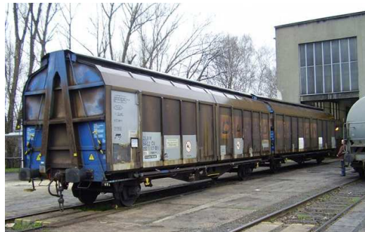
4 nápravový krytý velkoprostorový železniční vůz se třemi bočními přesuvnými stěnami na každé straně